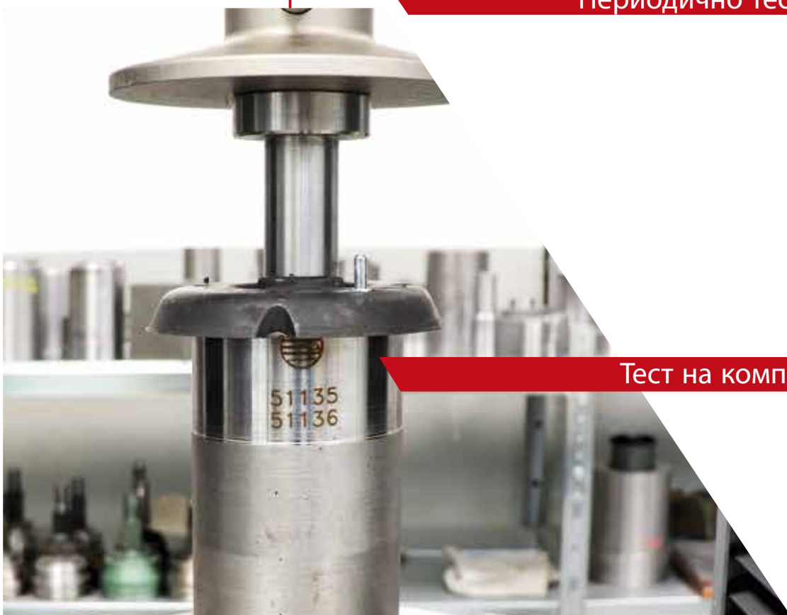
Тест на компресија